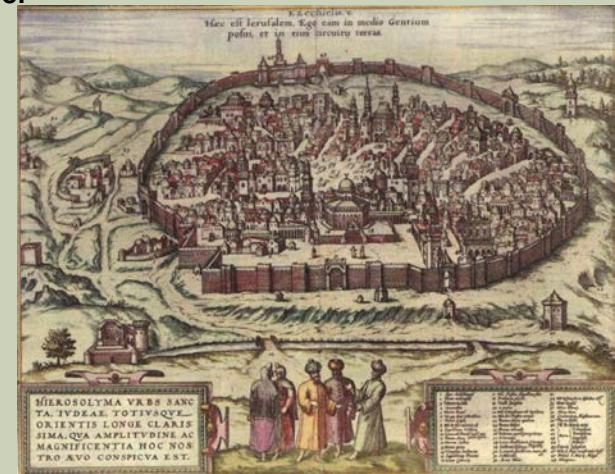
Gerusalemme, incisione acquerellata di Franz Hoberberg, 1590

La nostra storia, la storia dell'Europa e dell'Occidente, è storia giudaico-cristiana e greco-romana. Scendiamo da tre colline: il Sinai, il Golgota, l'Acropoli. E abbiamo tre capitali: Gerusalemme, Atene, Roma. Questa è la nostra tradizione. Da qui sono nati i nostri valori. Senza le leggi di Mosé, senza il sacrificio del Cristo, non avremmo quel sentimento morale che ci fa sentire tutti - credenti e non - fratelli, uguali, compassionevoli. Senza la ragione dei Greci e il diritto delle genti dei Romani, non avremmo quelle forme di pensiero che sorreggono le nostre istituzioni pubbliche.*