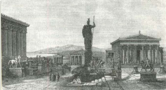
Acropoli di Atene , incisione 1875

Giovanni Battista Piranesi, Veduta dell'Arco di Costantino e dell'Anfiteatro Flavio detto il Colosseo (1747-48)