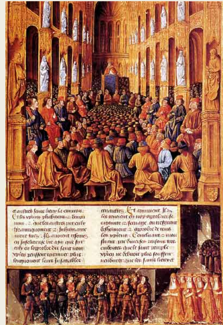
1 re croisade : Le pape Urbain II préside le concile de Clermont Sébastien Mamerot, Les Passages d'outremer faits par les Français contre les Turcs depuis Charlemagne jusqu'en 1462 . Manuscrit enluminé sur parchemin, Bourges, Jean Colombe, 1474-1475. BnF, Manuscrits (Fr 5594 fol. 19)

Les Passages d'outremer présentent une compilation, en partie légendaire, sur les croisades. L'intérêt pour la Terre sainte n'a jamais faibli durant tout le Moyen Âge, notamment dans la seconde moitié du Xe siècle où fleurissent des projets de reconquête. Des projets d'autant plus nombreux que celle-ci s'avère de moins en moins possible. Urbain II préside ici le concile de Clermont lors duquel il prêche la croisade, le 27 novembre 1095 . Le pape, qui avait gardé secret son projet, demande alors aux chrétiens de s'unir sous la bannière de l'église pour aller délivrer les Lieux saints. Non sans arrière-pensées politiques puisqu'il entend bien renforcer ainsi son pouvoir sur une chrétienté éclatée.