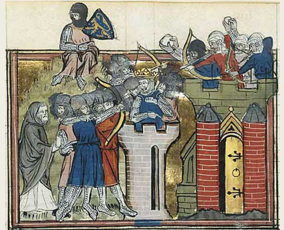
Ire croisade : siège de Jérusalem

L'assaut de Jérusalem est donné après des jours de jeûne et des processions conduites par le clergé. Les Francs, manquant de vivres et de matériaux, doivent attendre de se procurer du bois pour construire des échelles et des tours mobiles afin d'attaquer la muraille de la ville, tandis que celle représentée sur l'image est en pierre. Sur la gauche, un clerc encourage les croisés à prendre possession de Jérusalem. En haut, un chevalier franc, inconnu, se tient sur le mont des Oliviers, lieu symbolique pour les chrétiens. On reconnaît Godefroi de Bouillon, roi de Jérusalem, avec le titre d' "avoué du Saint-Sépulcre", dans la tour.