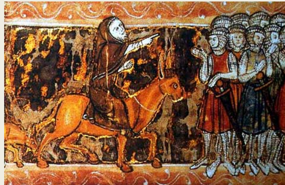
Ire croisade : Pierre l'Ermite harangue les croisés devant Jérusalem Roman du Chevalier du Cygne . Manuscrit enluminé sur parchemin. 3e tiers du XIIIe siècle. BnF, Arsenal (Ms 3139 fol. 176v)

Lors du siège de Jérusalem en 1099, il organise les processions autour de la ville et inspire les prières d'intercession des clercs et du peuple. On le voit haranguant des croisés en leur montrant d'un geste de la main le but à atteindre, la prise de Jérusalem. La ville prise, il revient en Occident avec des reliques.