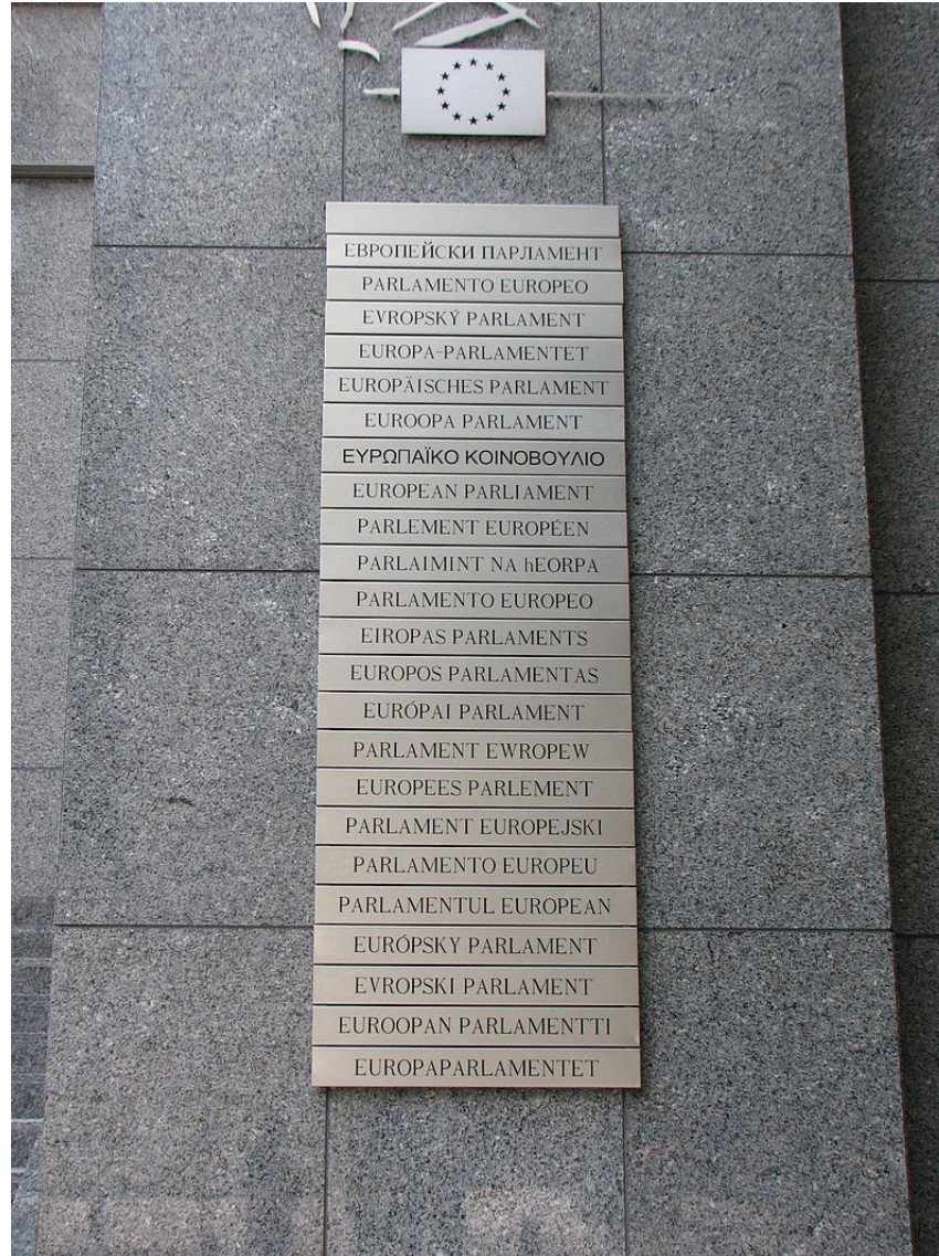
Panneau multilingue à l'entrée du siège du Parlement européen à Bruxelles

[ http://www.europarl.europa.eu/about-parliament/fr/organisation-and-rules/multilingualism ]