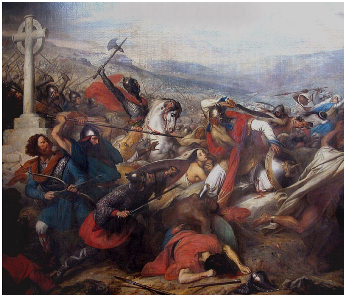
Charles Steuben, Charles Martel à la bataille de Poitiers , XIXème s.

C'est la première évocation connue de l'Europe comme civilisation et culture.