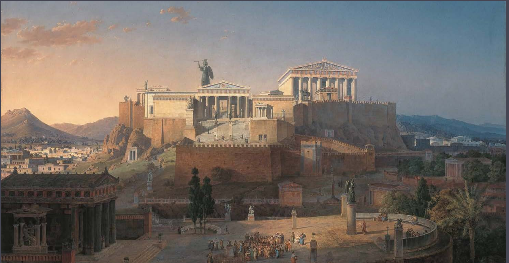
Leo von Klenze, L'acropoli di Atene , 1846