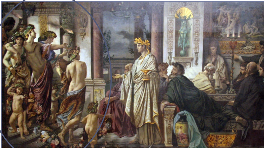
Anselm Feuerbach Il Simposio di Platone , 1871-1874