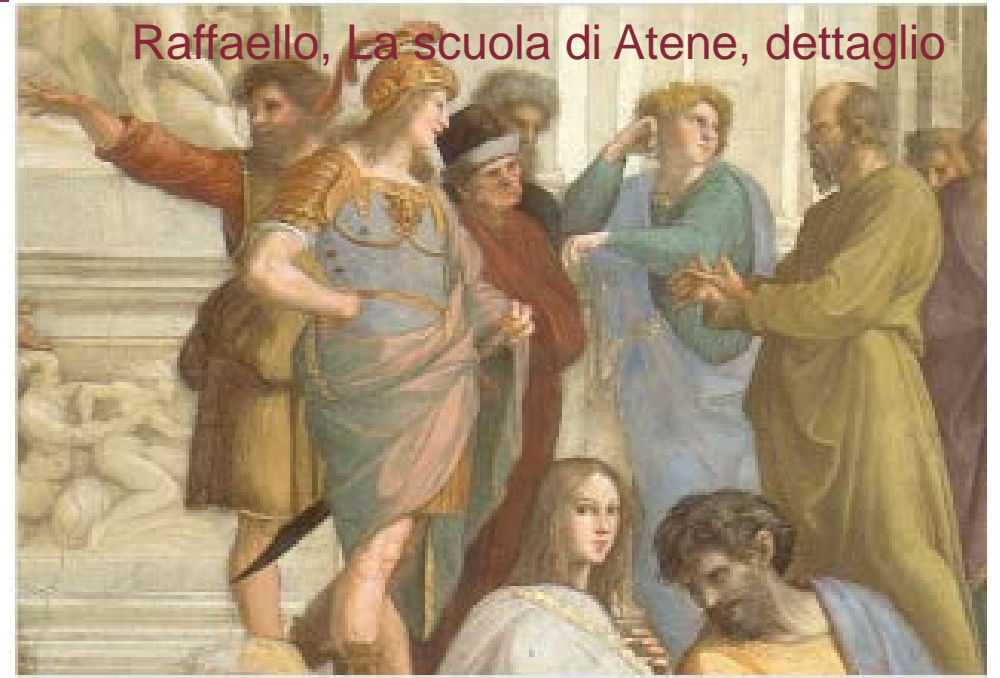
Raffaello, La scuola di Atene, dettaglio