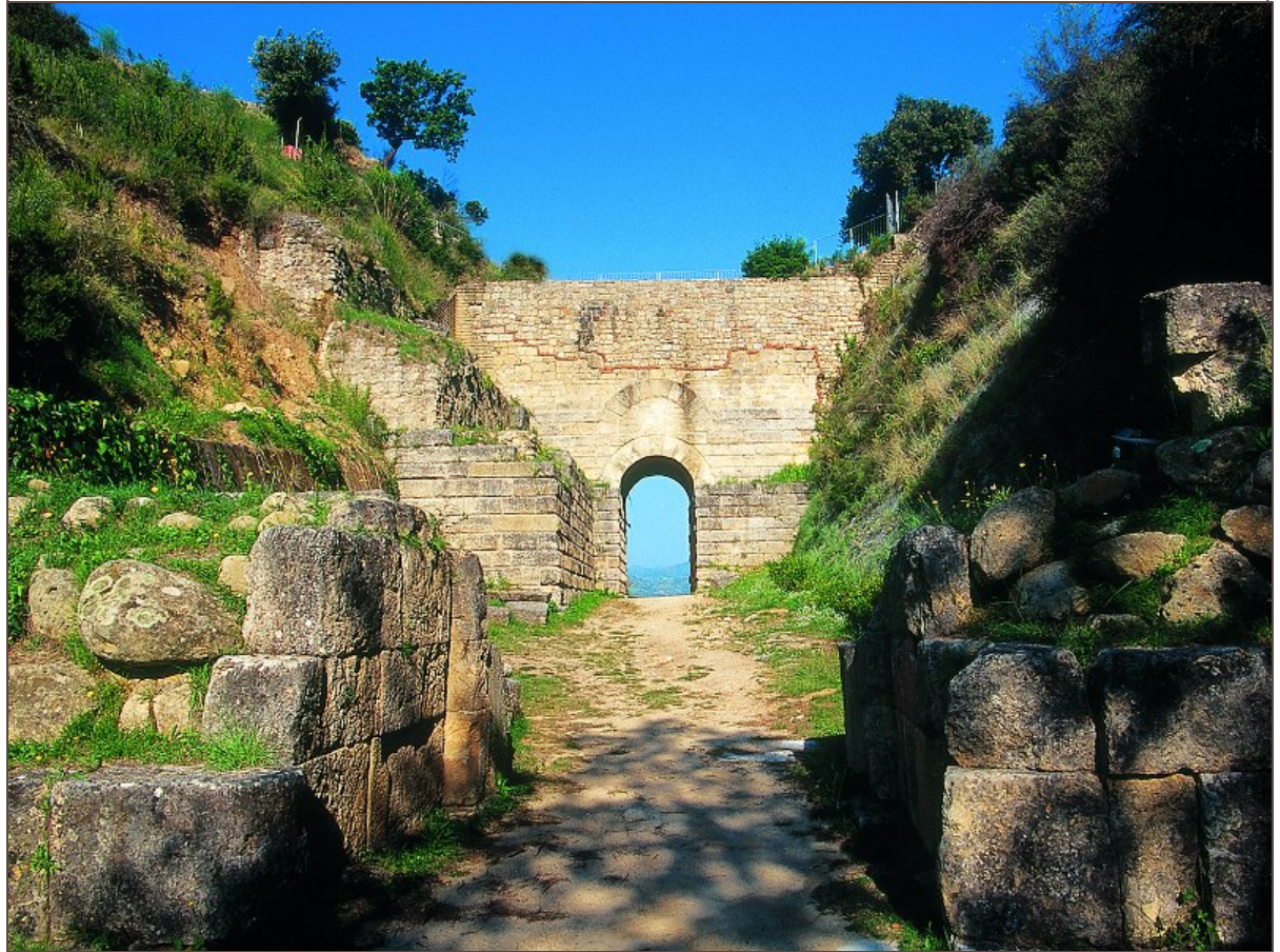
Porta Rosa di Velia/Elea

Sezione TESTI , testo 1, pp. 75, rr. 1-6 e 11-14