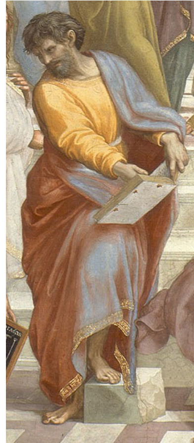
Raffaello, La scuola di Atene , dettaglio