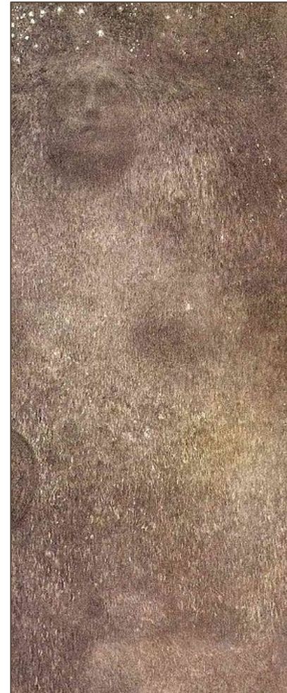
Klimt, La filosofia (particolare)

[.. .] la filosofia non è semplice conoscenza del mondo, filosofia è interrogarsi sugli enigmi che appaiono sullo sfondo di questo mondo che ci si apre davanti. H-G. Gadamer