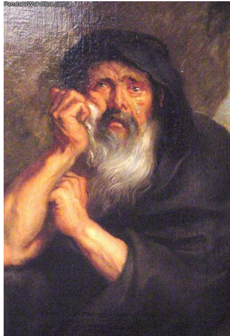
Rubens, senza titolo , 1603 ca

[Eraclito] ogni volta che usciva in pubblico piangeva [...] tutte le nostre azioni gli parevano misere. [Seneca, La tranquillità dell'animo ]