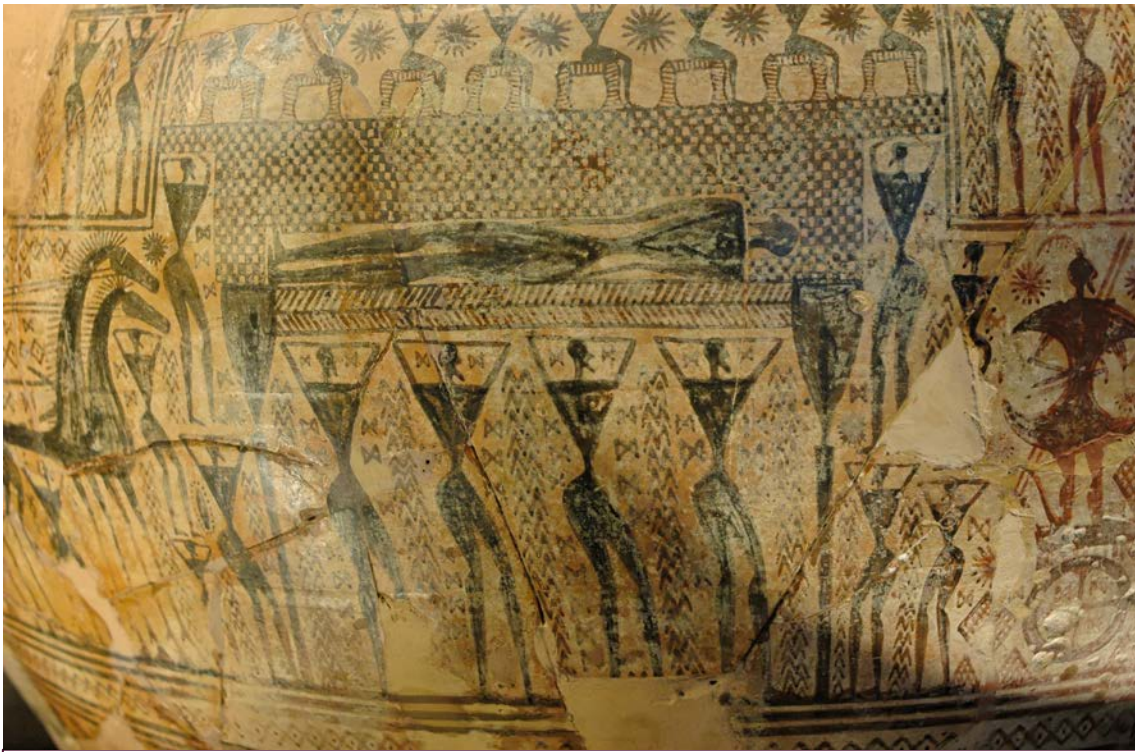
Maestro del Dipylon, frammento un Cratere funerario, 750 a.C. ca. Dal Dipylon di Atene. Parigi, Musée du Louvre

Rifacendosi agli studi dello storico dell'arte tedesco Gerhard Krahmer (1890-1931), Snell evidenzia inoltre che la raffigurazione artistica dell'uomo procede parallelamente alla riflessione filosofica su di esso . In una fase iniziale, sia l'arte sia il pensiero non riescono a cogliere l'essere umano come qualcosa di organico e in sé compatto. Nell' Iliade e nell' Odissea , l'uomo è descritto come una molteplicità dispersa di organi, funzioni e parti, e non come qualcosa di unitario e organizzato attorno a un proprio centro. Il corpo, in particolare, è concepito come un insieme di membra: per questo Omero usa in prevalenza termini plurali, tra cui méle , che indica le parti del corpo, e gýia , che indica le estremità, ad esempio le gambe o i piedi.