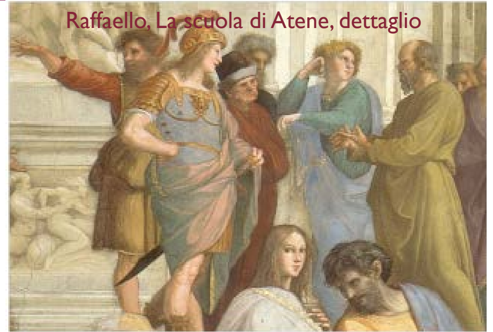
Raffaello, La scuola di Atene, dettaglio