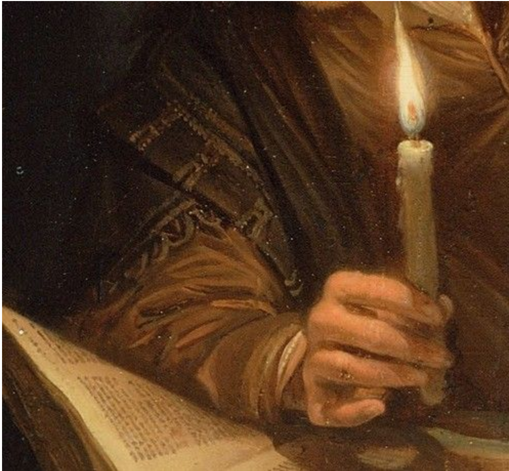
Gerrit Dou, The Astronomer By Candlelight , XVII sec