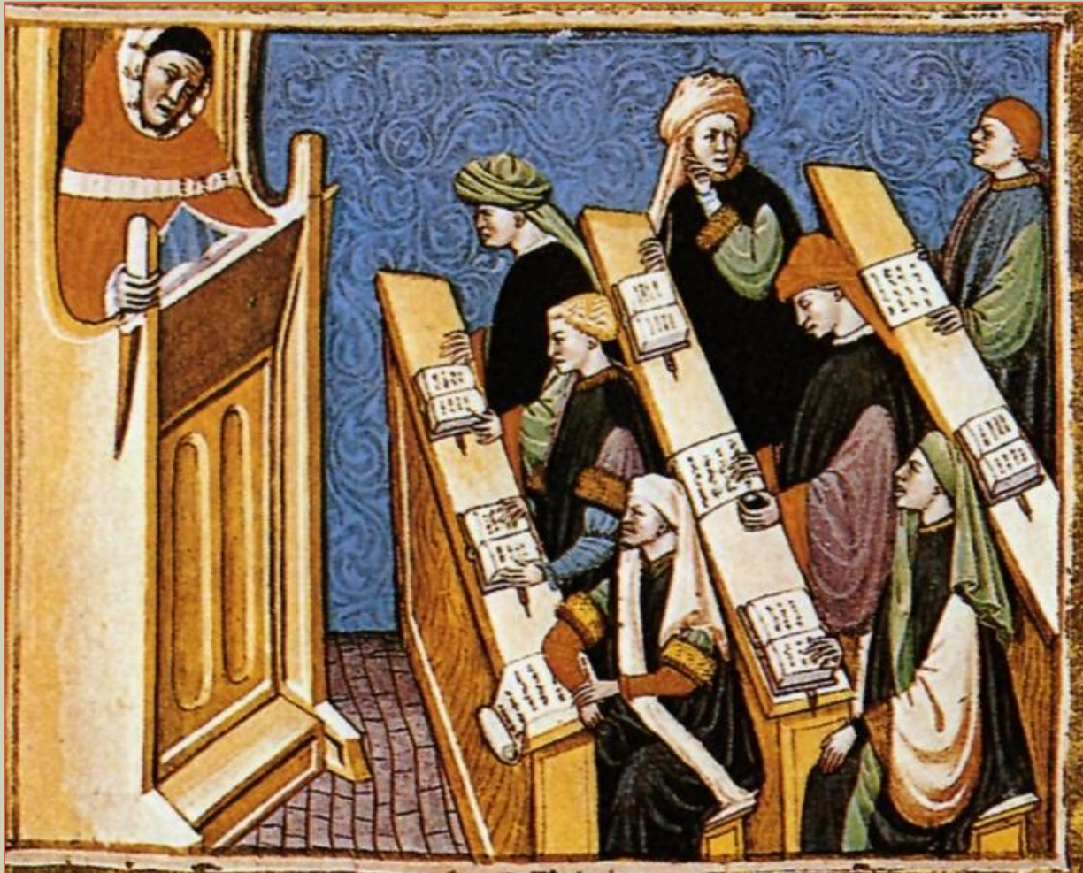
Una lezione all'università di Bologna, XIII secolo