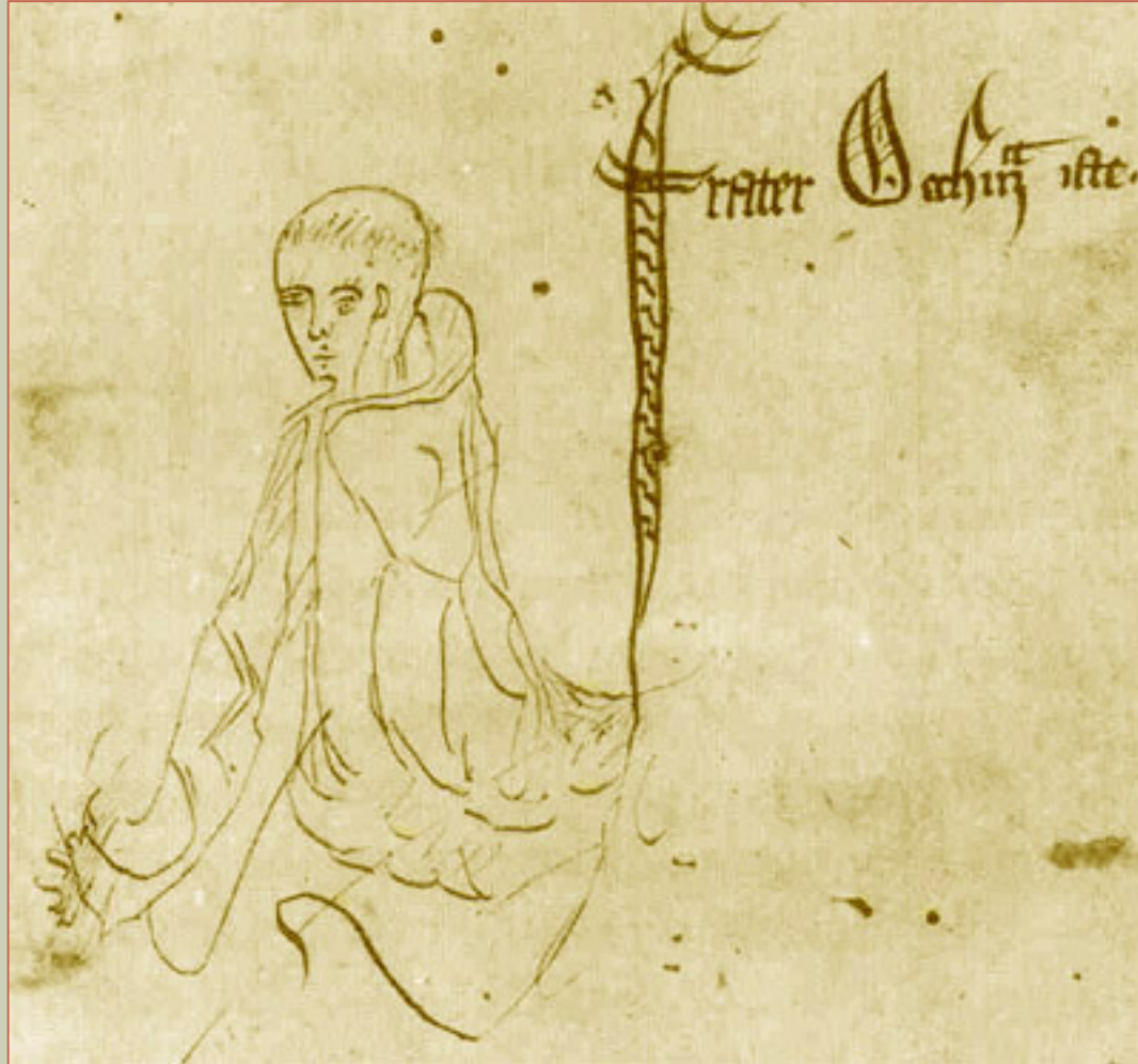
Schizzo etichettato 'frater Occham iste', Summa logicae , 1341