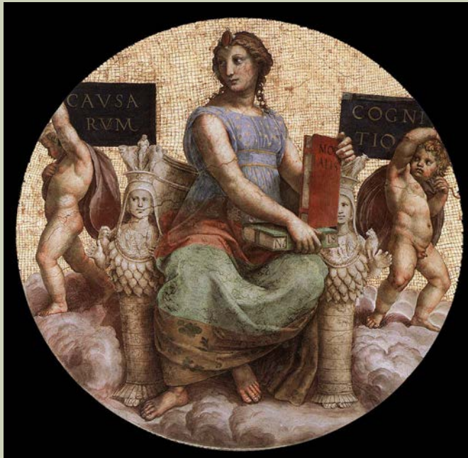
Raffaello, Stanza della segnatura, Filosofia , 1508