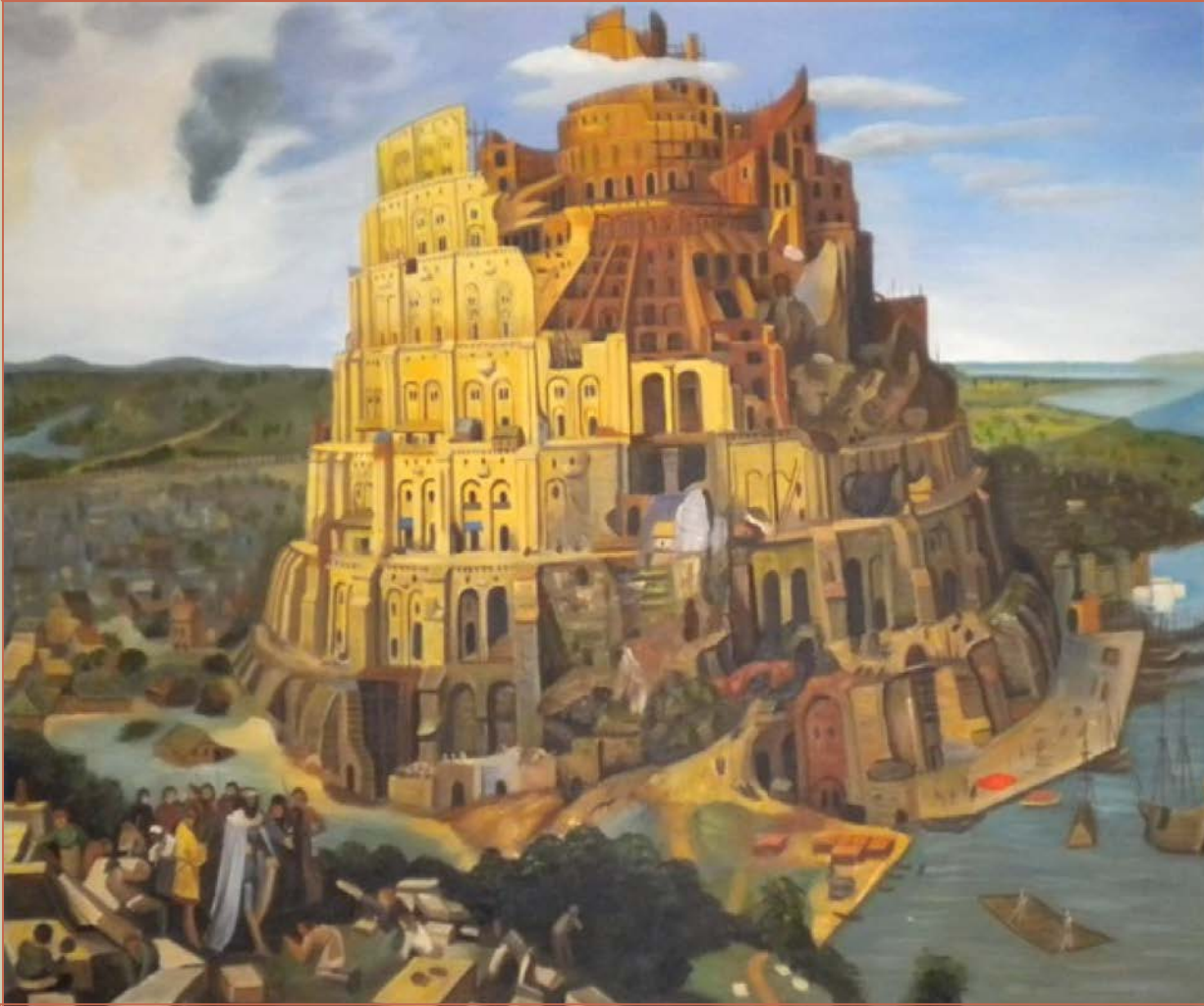
Pieter Bruegel il Vecchio, La torre di Babele , 1563

[R. Panikkar, Lo spirito della parola , Bollati Boringhieri, Torino 2007, p. 76 e p. 185