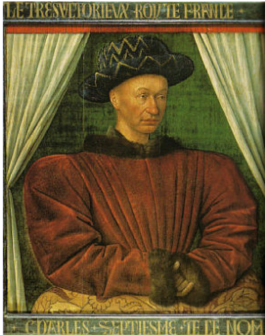
Charles VII "le victorieux" (tableau anonyme)