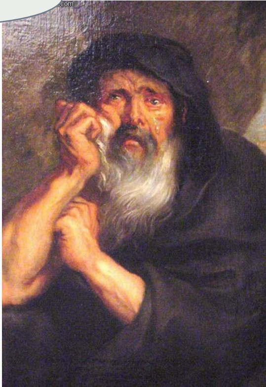
Rubens, senza titolo , 1603 ca