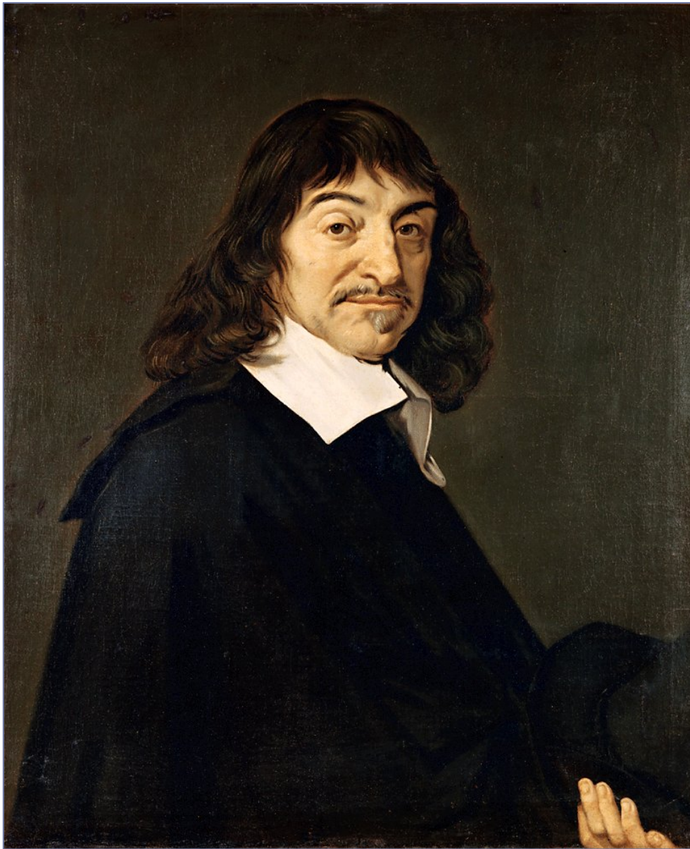
Frans Hals, Ritratto del filosofo R. Descartes , 1650