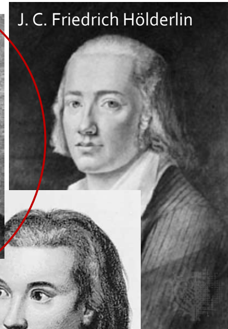
J. C. Friedrich Hölderlin