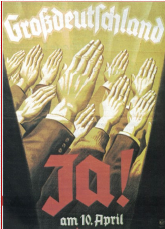
Manifesto di propaganda tedesco per l'Anschluss austriaco, 1938