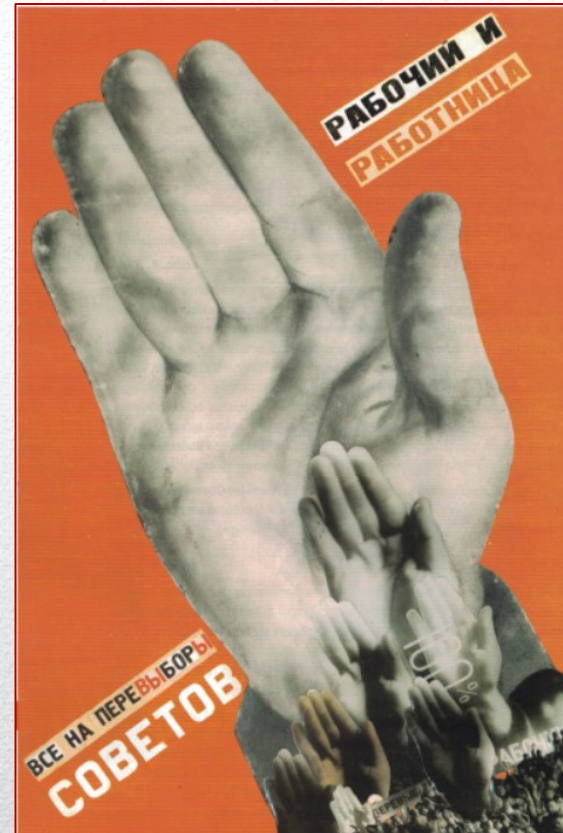
Operai, operaie, partecipate tutti alle elezioni sovietiche, 1930.

Il Totalitarismo . Affinità di intenti . Saldare la comunità degli individui intorno ad un obiettivo comune , che sia razziale, sociale o politico.