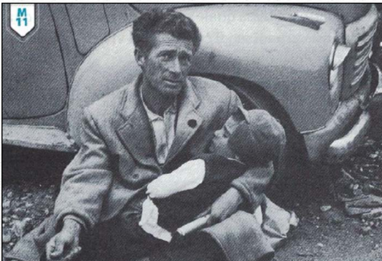
Un mendicante a Bologna, 1954