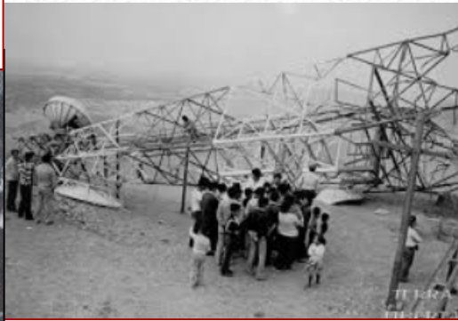
Attentati ai tralicci dell'alta tensione, 1961

IL CONFINE ORIENTALE. Con il Memorandum di Londra del 1954 il Territorio Libero di Trieste cessa di esistere e la città di confine passa all'Italia, mentre una fascia di territorio a est rispetto a Trieste va alla Jugoslavia. Un'ulteriore ondata di profughi [...] si riversa in Italia [...]. L'accoglienza dei nuovi venuti non è sempre facile, nel contesto internazionale della Guerra fredda e delle accese contrapposizioni ideologiche [...]. Fin dall'inizio l'arrivo dei profughi viene infatti attribuito, in particolare dalla DC e dalla Chiesa, esclusivamente alle vessazioni del governo comunista jugoslavo, e si evita sistematicamente di menzionare la sconfitta militare subita dall'Italia nella Seconda guerra mondiale e le responsabilità del fascismo nello scatenamento del conflitto e nell'invasione del territorio jugoslavo nel 1941.