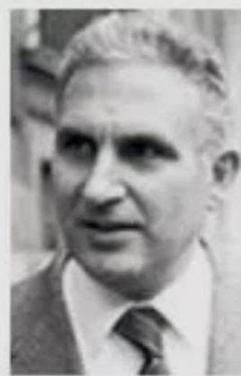
Pio La Torre