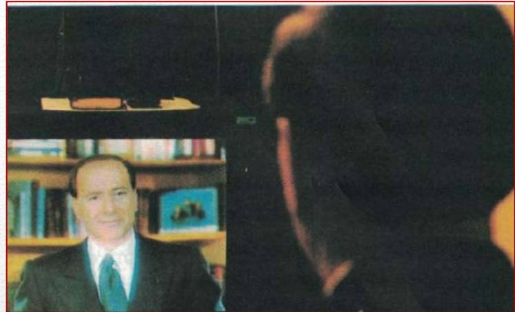
Silvio Berlusconi si guarda in Tv

So quel che non voglio e, insieme con i molti italiani che mi hanno dato la loro fiducia in tutti questi anni, so anche quel che voglio. E ho anche la ragionevole speranza di riuscire a realizzarlo, in sincera e leale alleanza con tutte le forze liberali e democratiche che sentono il dovere civile di offrire al Paese una alternativa credibile al governo delle sinistre e dei comunisti.