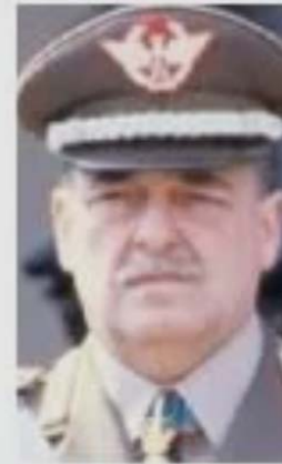
Carlo Alberto dalla Chiesa