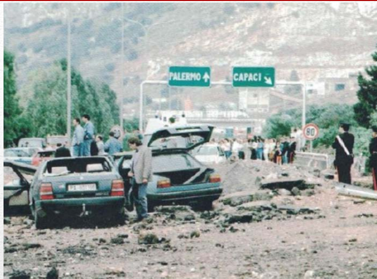
23 maggio 1992: la strage di Capaci

26 settembre 1988: uccisione dell'attivista e giornalista Mauro Rostagno